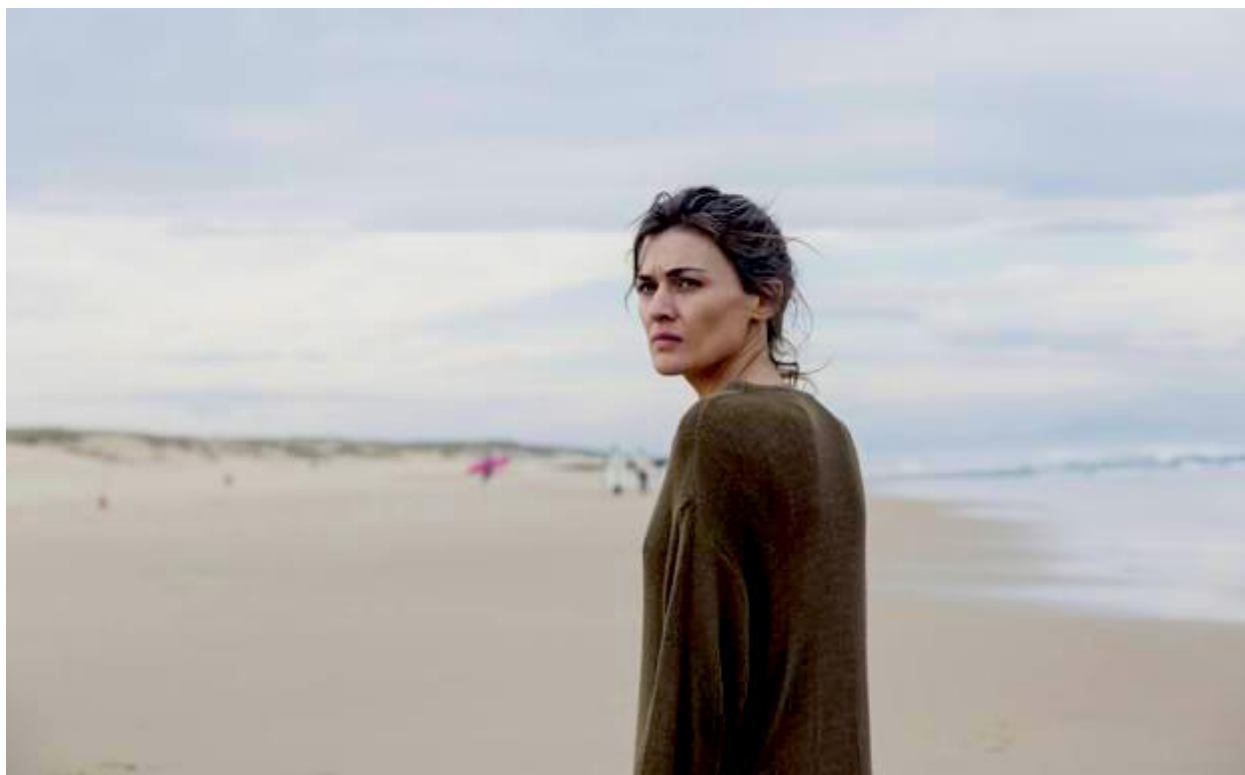
'Madre' , de Rodrigo Sorogoyen

'Madre' , de Rodrigo Sorogoyen, era la gran esperanza de España en los Oscar. Lo tenía todo para triunfar: una factura intachable, un guion impecable y un argumento desgarrador. Y aunque finalmente el premio se lo llevara el corto americano Skin, su candidatura demostró la pujanza que este género, a menudo considerado menor, tiene en nuestro país y en Europa. Una muestra de ello son los numerosos festivales exclusivamente dedicados al cortometraje que se celebran cada año en el continente, que sirven tanto como plataforma de promoción de jóvenes talentos como de escaparate para producciones audiovisuales de corte experimental.